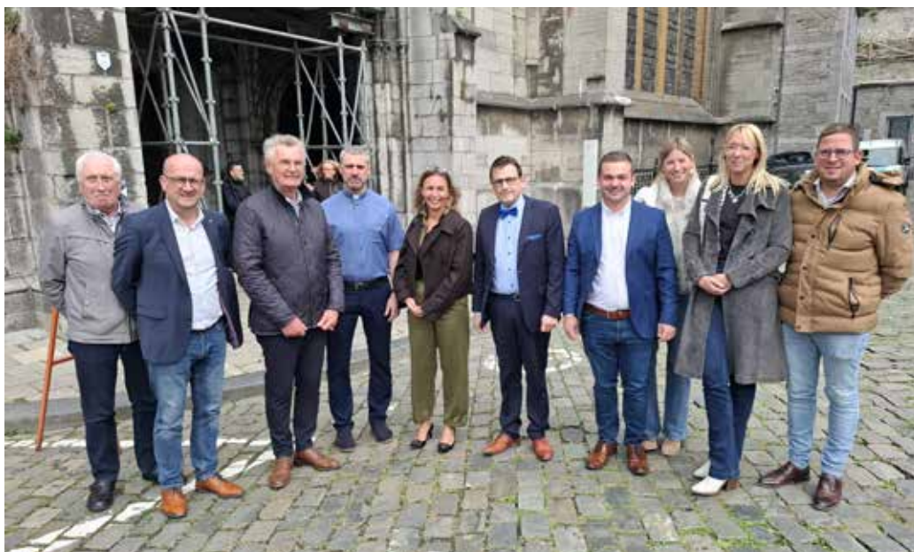
« On ne peut pas laisser des sites tels que ceux-ci à l'abandon », a déclaré la Ministre.

La visite de Madame la Ministre Lescrenier marque une étape importante pour Dinant. Le soutien apporté à la Collégiale, tant symbolique que financier, ouvre la voie à une restauration attendue depuis longtemps. La ville, avec l'appui de la Région, s'engage dans une dynamique de préservation durable de son patrimoine, au bénéfice des générations futures.