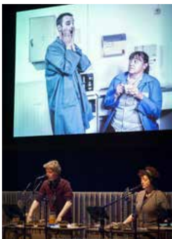
ZAI ZAI