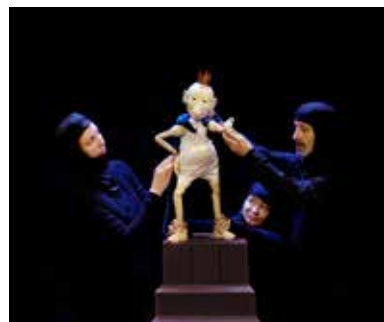
POUVOIR © Céline Chariot

Quand une marionnette décide de se révolter contre ses manipulateurs et de reprendre le pouvoir... Un spectacle qui questionne notre système démocratique avec intelligence et humour. Tarifs de 11 à 15 €.