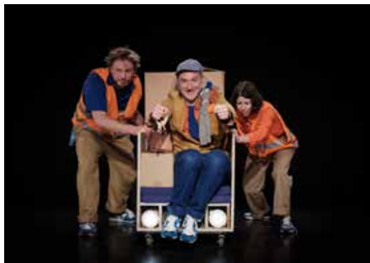
TOC TOC TOC

Toc Toc Toc (dim 22|02 à 15h00) : Monsieur Bébé, un ancien bébé, imagine d'où il vient. Un spectacle bourré de tendresse et d'espièglerie autour de la naissance et de la famille. De 4 à 7 ans. Goûter offert après le spectacle. Tarif : à pd 8 €.