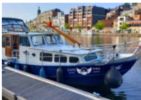
Installée littéralement à bord d'un bateau de plaisance

C'est sur l'eau que se dessinent les trajectoires de vie accompagnées par l'ASBL A Bord de la Lumière. Fondée sur des valeurs de respect, d'écoute et d'émancipation, l'association développe une approche humaine de l'accompagnement, mêlant interventions indivi-