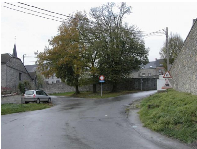
Projet 1 : plan des travaux à Thynes, phase 1

Lancement de l'appel d'offre retardé pour y intégrer les travaux BELGACOM. Approbation de l'adjudication retardée ensuite pour mise en cause de l'offre retenue (prix jugé trop bas) et finalement retenue en octobre 2010. Subvention accordée par le Ministre de la Ruralité en janvier 2011. Début des travaux attendus pour octobre 2011 (et éviter une interruption pendant les vacances et un chantier à la rentrée des classes).