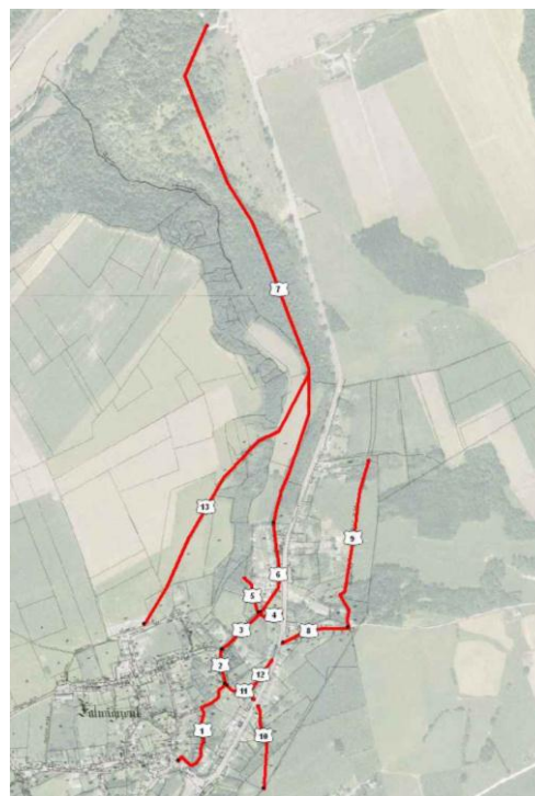
Projet 2 : tracé des sentiers au long de la Prée