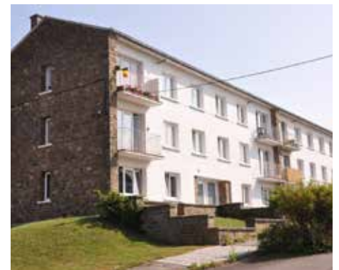
Herbuchenne : 42 appartements en trois blocs – Rénovation prévue en 2021