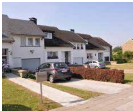
Herbuchenne : 14 maisons Rue du Grand-Pré – Rénovation prévue en 2022