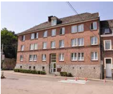
Bouvignes – 18 appartements Rénovation prévue en 2021